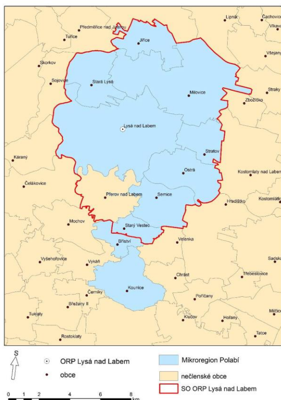
Obr. č. 1. Mapa Mikroregionu Polabí